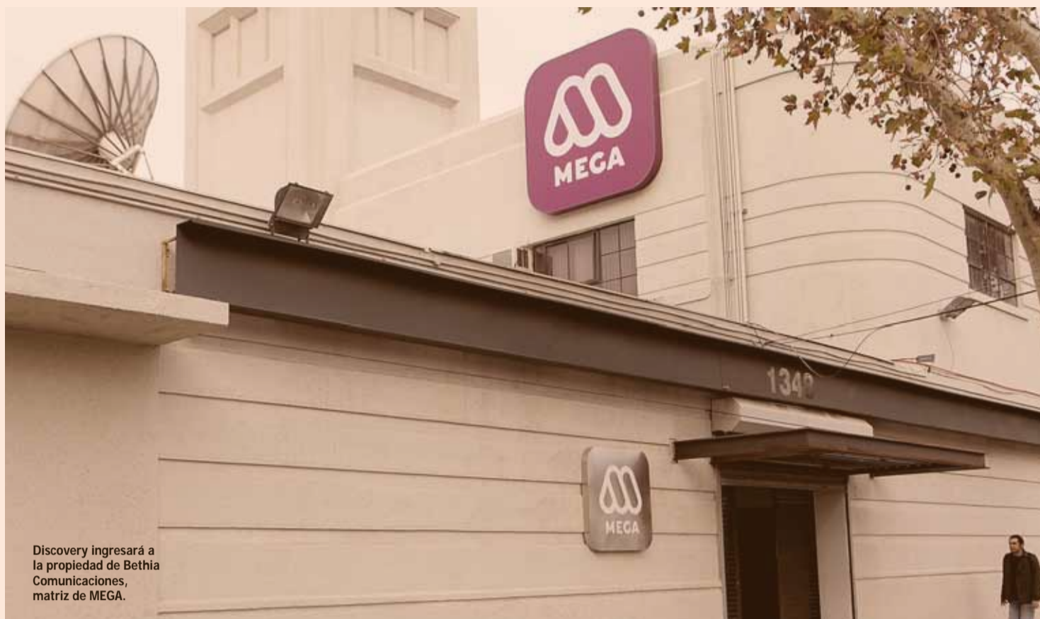
Discovery ingresará a la propiedad de Bethia Comunicaciones, matriz de MEGA.

En el sector combustibles, el fondo de private equity Southern Cross Group logró un acuerdo con Petróleo Brasileiro para la adquisición del 100% de Petrobras Chile Distribución, en US$ 490 millones. Con esto, se hará de 279 estaciones de servicio además de ocho terminales propios y operaciones en once aeropuertos. El cierre de la transacción se concretará una vez obtenidas las aprobaciones correspondientes.